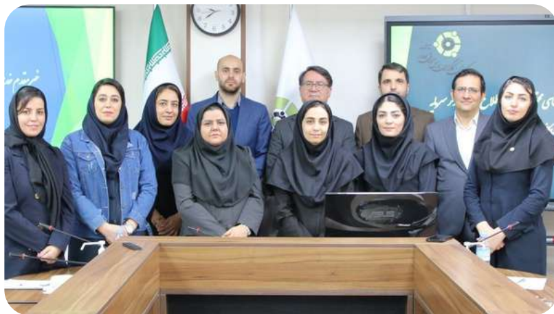
(یکصد و هفدهمین جلسه شورای اطلاع‌رسانی بازار سرمایه)