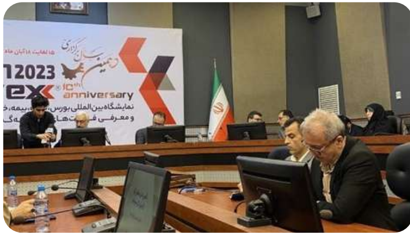
نمایشگاه بین‌المللی بورس، بیمه و بانک کیش (KISHINVEST ۲۰۲۳)