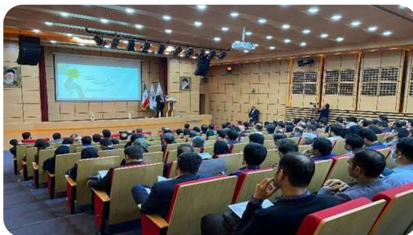
(نشست فصل پاییز کنون با موضوع بررسی «مقررات و مخاطرات ناظر بر معاملات در بازار سرمایه»)