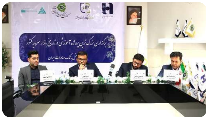
(نشست مشترک خبری کانون با کارگزاری بانک صادرات به منظور معرفی بزرگترین پروژه آموزشی تاریخ بازار سرمایه کشور)