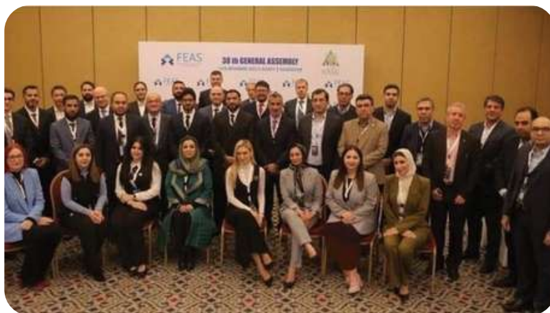
(سی و هشتمین نشست فدراسیون بورس‌های آسیایی/اروپایی (FEAS))